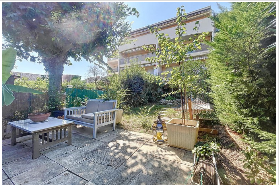
Apartment 1408 Antibes