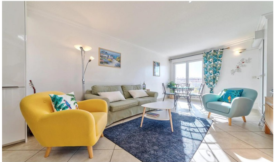
Apartment 11111 Juan-les-Pins