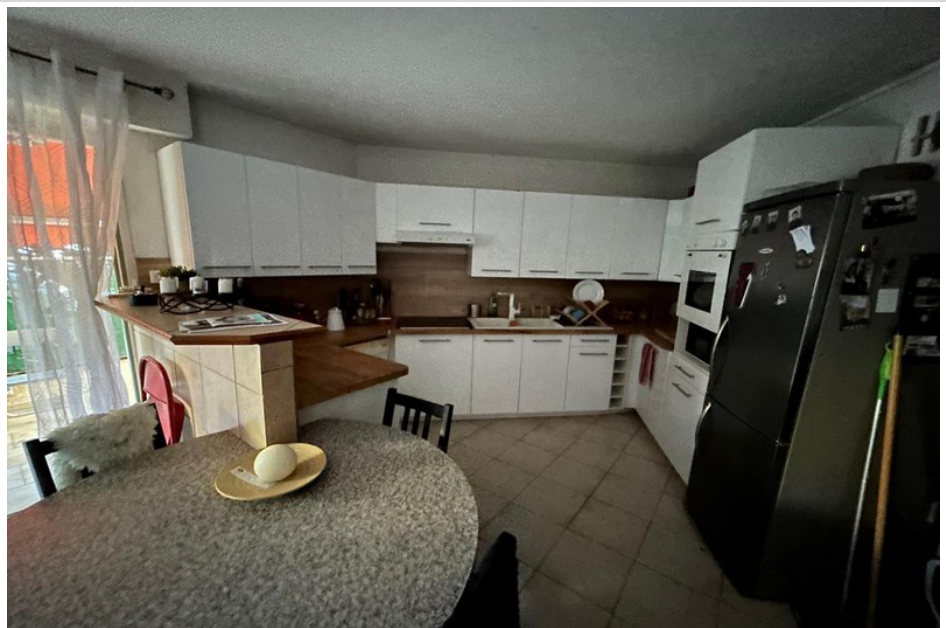
Apartment 10118 Antibes