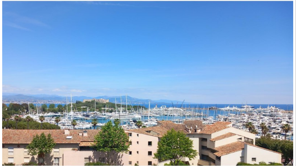
Apartment 10109 Antibes