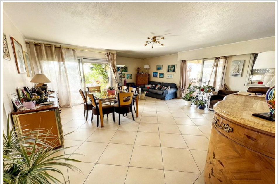
Apartment 5002 Antibes

559 000 € honoraires inclus honoraires inclus well condominium(58 lots in the condominium), aucune procédure en cours, information on the risks to which this property is exposed is available on georisques.gouv.fr