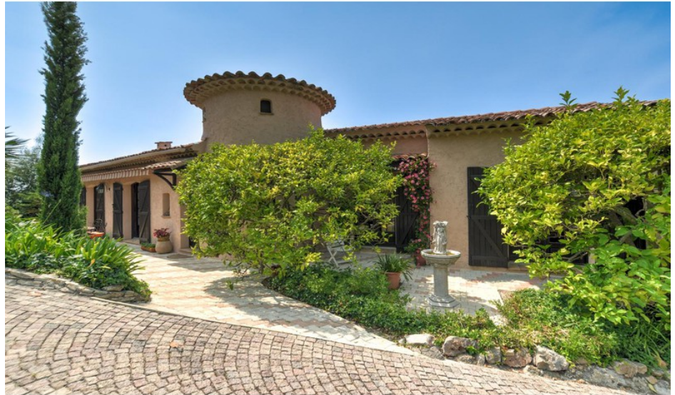
Bastide 237 Vallauris

honoraires inclus aucune procédure en cours, information on the risks to which this property is exposed is available on georisques.gouv.fr